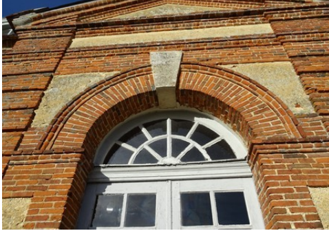
Un détail de la travée centrale côté Sud