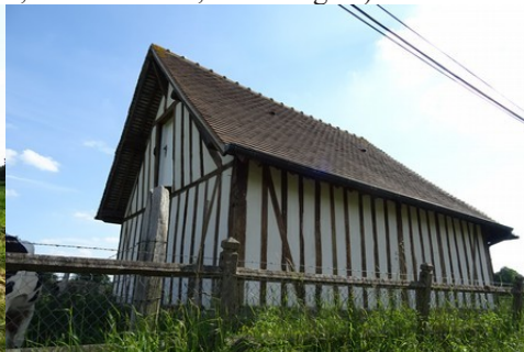
Un exemple d'architecture rurale