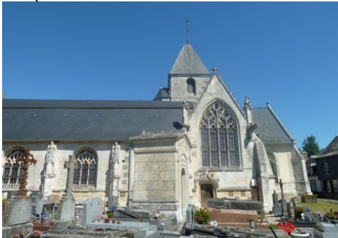
L'église de Plasnes (inscrite)