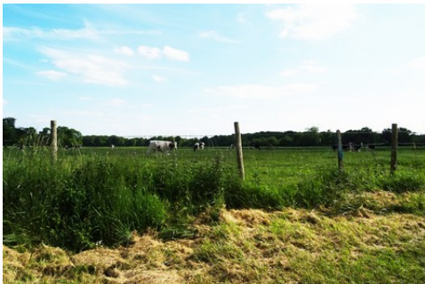
Les prairies alentours

Les avis seront cohérents avec ceux émis ces derniers années, à savoir : pas de maisons à volume compliqué (type V, W, Y, ou Z), pentes à 45° pour les volumes principaux, ardoise ou tuile plate de teinte brun vieilli, à 20u/m 2 , avec un débord de toiture de 20cm, enduit de teinte beige clair avec modénatures (au choix : chaînages, encadrement de fenêtres, soubassement, colombage...). *Voir les autres fiches.