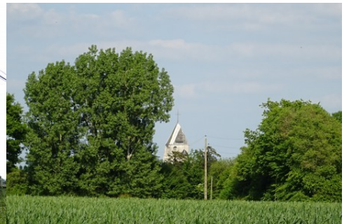
Le clocher de Plasnes vu des champs