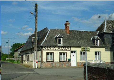
Quelques maisons de Plasnes