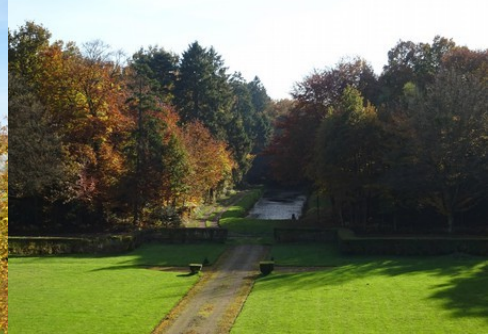
La vue vers le parc et sa pièce d'eau

Pour la zone en rose foncé dans le périmètre de 500m