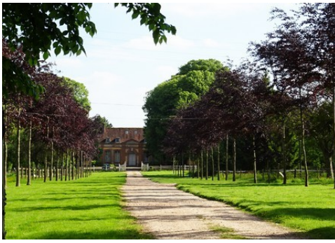
Le château depuis son allée d'accès