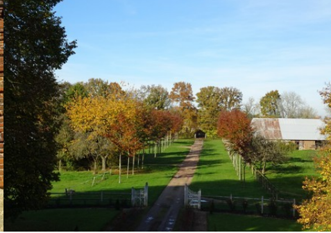
La perspective vers le Nord