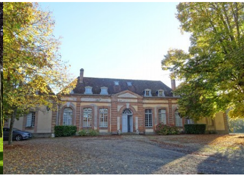
La façade nord du château (vue proche)