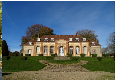
La façade sud (vue proche)